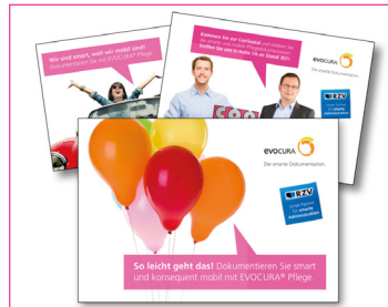
Das Bild zeigt die ersten drei Postkartenmotive

Mit frischen Motiven wendet sich EVOCURA seit Oktober mit einer Postkartenaktion an potenzielle Neukunden. Etwa alle sechs bis acht Wochen verschickt EVOCURA eine Postkarte an potenzielle Interessenten. Die Vorderseite zeigt ein Bild als Blickfang, die Rückseite erläutert das Produkt EVOCURA® Pflege.